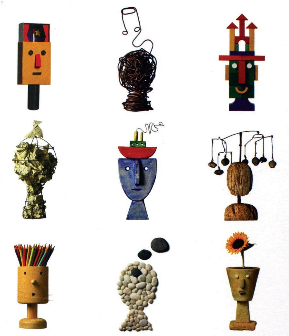
Imaxe 1: Colección de "cabezas pensantes". Deseño: Carlos Sánchez Lacaste (ilustracións : Pep Carrió, proxecto gráfico: José Luís de Hijos, fotografías: Enrique Cotarelo)