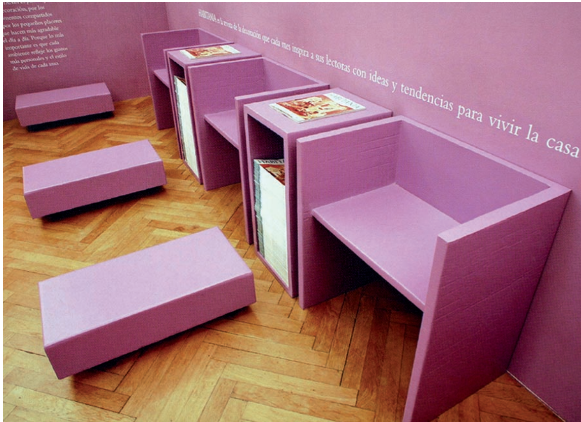
Imaxe 1: Recuncho de lectura da revista Habitanía nunha exposición de interiorismo. Todo o mobiliario é de cartón pintado. Deseño: María de Ros Padrós.