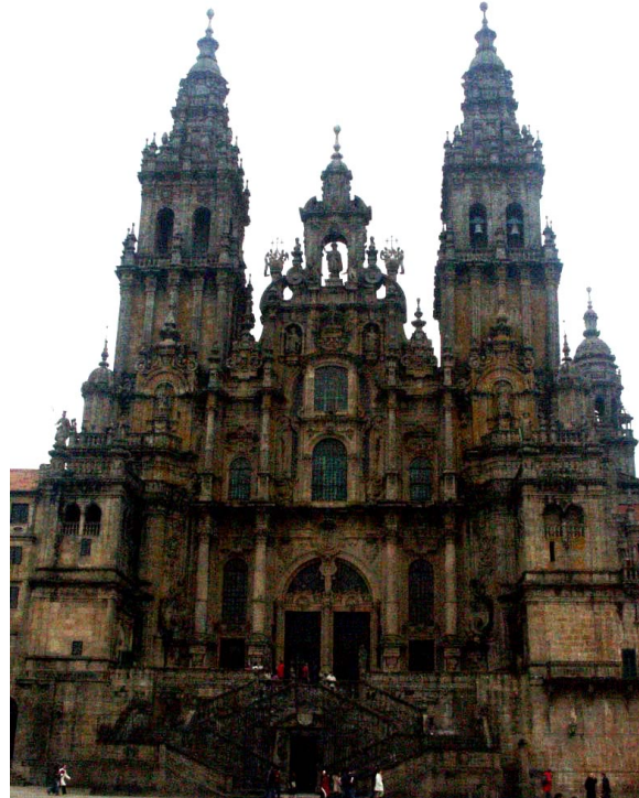
Lámina 2 (hasta 4 puntos) / Lámina 2 (ata 4 puntos)

Analiza tipológicamente y señala las características formales de esta obra (hasta 1 punto). / (hasta 1 punto). / Analiza tipoloxicamente e sinala as características formais desta obra (ata 1 punto).