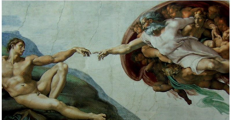
Lámina 2 (hasta 4 puntos). / Lámina 2 (ata 4 puntos).

Estúdiala iconográfica y formalmente hasta 2 puntos). / Estuda iconográfica e formalmente esta obra (ata 2 puntos).