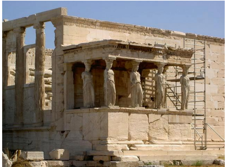
Lámina 2 (hasta 4 puntos). / Lámina 2 (ata 4 puntos).

Señala sus características formales (hasta 1 punto). / Sinala as súas características formais (ata 1 punto).