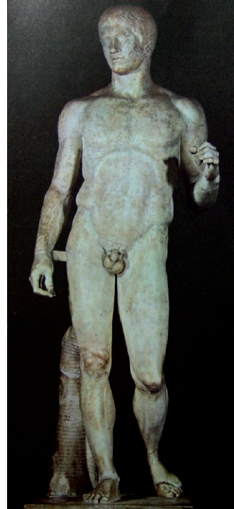
Lámina 2 (hasta 4 puntos). / Lámina 2 (ata 4 puntos).

Realiza un estudio formal de la obra incidiendo en el análisis de su canon (hasta 2 puntos). / Realiza un estudio formal da obra incidindo na análise do seu canon (ata 2 puntos).