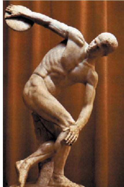
Lámina 2 (hasta 4 puntos) / Lámina 2 (ata 4 puntos)

Realiza un estudio formal de la obra incidiendo en su concepción espacial (hasta 2 puntos). / Realiza un estudio formal da obra incidindo na súa concepción espacial (ata 2 puntos).