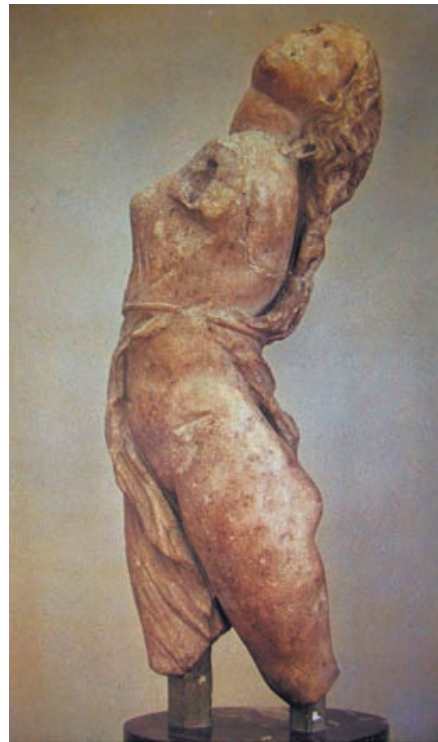
Lámina 2 (hasta 4 puntos). / Lámina 2 (ata 4 puntos).

Realiza un estudio iconográfico y formal de la obra incidiendo en su concepción espacial (hasta 2 puntos). / Realiza un estudio iconográfico e formal da obra incidindo na súa concepción espacial (ata 2 puntos).