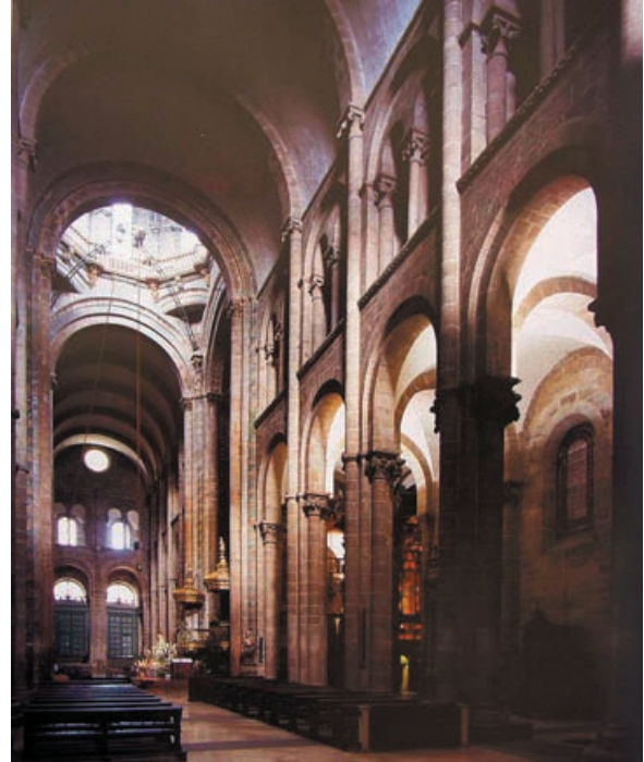
Lámina 2 (hasta 4 puntos). / Lámina 2 (ata 4 puntos).

Señala sus características formales (hasta 1 punto). / Sinala as suas características formais (ata 1 punto).