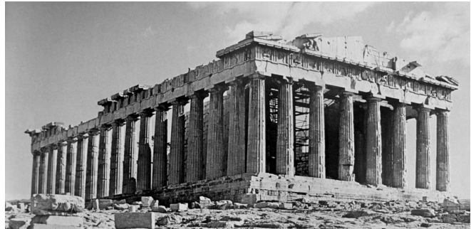
Lámina 2 (hasta 4 puntos) / Lámina 2 (ata 4 puntos)

Señala sus características formales y espaciales (hasta 1 punto) / Sinala a suas características formais e espaciais (ata 1 punto).