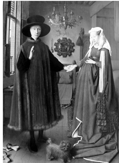
Lámina 2 (hasta 4 puntos). / Lámina 2 (ata 4 puntos).

Estudia esta obra iconográfica y formalmente (hasta 2 puntos) / Estudia esta obra iconográfica e formalmente (ata 2 puntos).