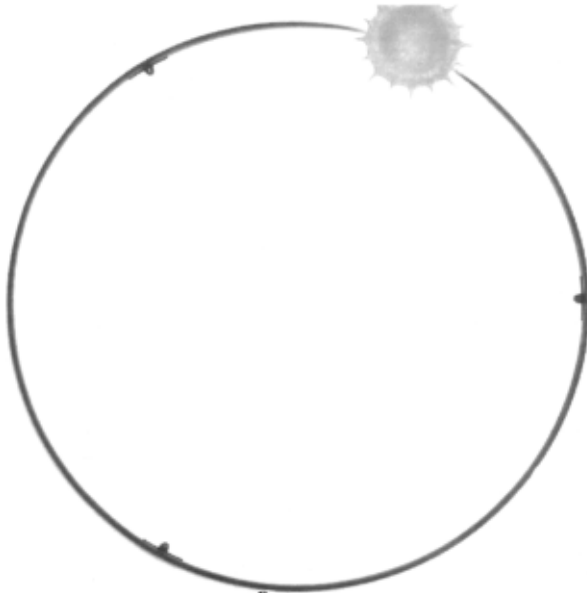
○ sole mio Gaetano Pesce ● Progetti

1.2 – Efectúa unha proposta de deseño para un reloxo de sobremesa, definindo materiais, cores, texturas, etc.